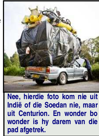
Nee, hierdie foto kom nie uit Indië of die Soedan nie, maar uit Centurion. En wonder bo wonder is hy darem van die pad afgetrek.