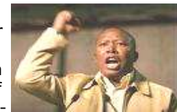
FOOLIUS DILEMMA, ook bekend as Julius Malema.