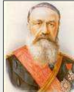
Genl. Piet Joubert

My vriend het 'n heeltemal nuwe siening oor die sokie. Hy vertel dat toe genl. Piet Joubert vir George White en sy manne in Ladysmith vasgekeer het, het hy 'n Boere-verkenner gestuur om in Durban te gaan kyk hoeveel soldate die Engelse nou regtig het.