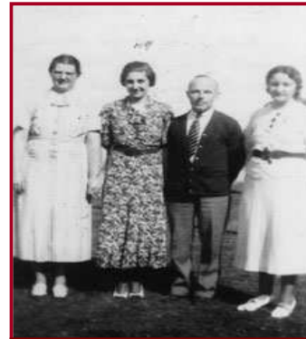
Toe die onnies hul hare gereeld gedoen en lang rokke en hoëhakskoene gedra het?