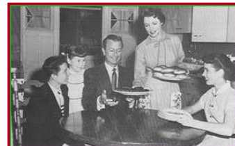
Toe amper almal se ma's ná skool tuis was?