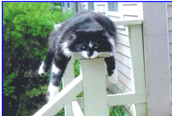
Los my uit! Jy kan mos sien ek slaap nou!

Aanbieder: Verkeerd, jammer. Kom ons probeer nog 'n vraag. In watter land is die Parthenon? Deelnemer: Parys.