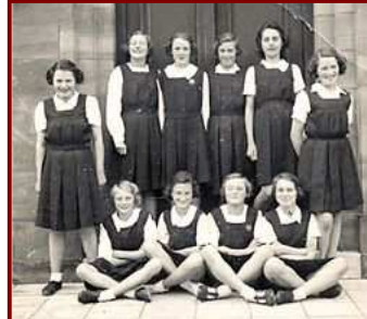
Toe die skoolmeisies nog springjurke gedra het?