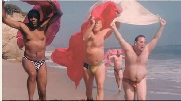
Hoekom hulle vroue vir strandfoto's kies