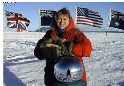
Dr. Jerri Nielsen

Daar moet seker nog heelwat gevalle wees waar dokters en ekspedisielede beseer is. Volgende keer vertel ek van dié wat minder gelukkig was hier by die Suid-Afrikaanse basis.