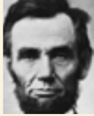
Abraham Lincoln en Stephen Douglas

Nadat Douglas hom 'n tweegesig genoem het: "Ek sal die gehoor daaroor laat besluit. Dink julle ek sal hierdie gesig dra as ek 'n ander een gehad het?"