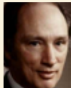
Pierre Trudeau en Richard Nixon

Nadat Douglas hom 'n tweegesig genoem het: "Ek sal die gehoor daaroor laat besluit. Dink julle ek sal hierdie gesig dra as ek 'n ander een gehad het?"