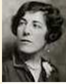
Edna Ferber en Noel Coward

Die skryfster het met 'n pak klere by 'n funksie opgedaag. Coward: "Jy lyk amper soos 'n man."