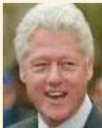
Bill Clinton en Dan Quayle

Quayle het gesê hy gaan die 1992-verkieping soos 'n bulhond aanpak. Clinton: "En dit sal natuurlik elke lampaal in Amerika laat bewe."