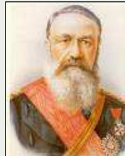
Genl. Piet Joubert

"Nou maar goed dan," vertel hy die Boereverkenner "dan beter ons net hier by Ladysmith bly. As ons nou Durban gaan beset en al daai Engelse krygsgevangene moet neem, sal ons vir hulle kos en slaapplek moet gee. Dit sal nooit deug nie."