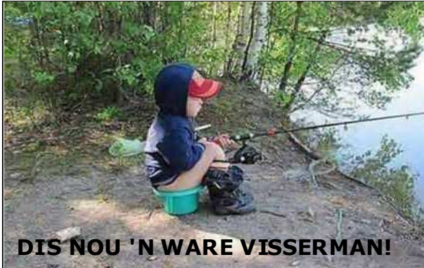
DIS NOU 'N WARE VISSERMAN!

As jy 'n giggel wil deel, vonk dit aan pos@onsdorp.com