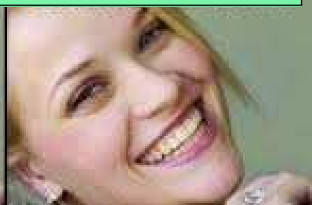
SONDER HAAR LEPEL