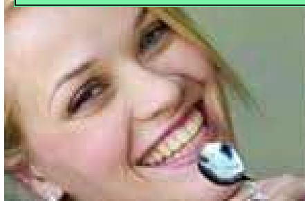
MET HAAR LEPEL