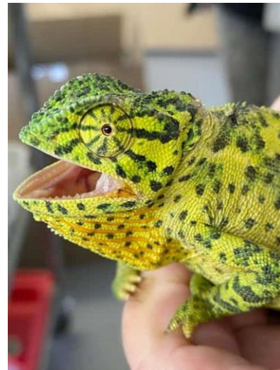
Die verkleurmannetjie wat die media gehaal het toe sy na mishandeling 'n keisersnee ondergaan het. Die kleintjies is gered dog sy is later dood.