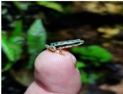
kyk hoe klein