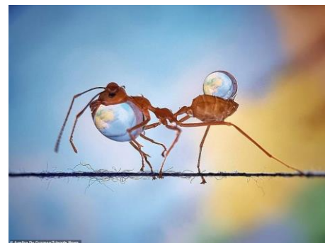
Mier met druppels water FB