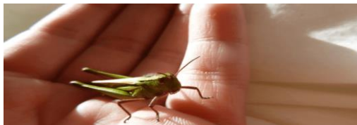
'n Troeteldier in China. Sedert die 14e eeu hou hulle ook kriekgevegte. Daar is selfs jaarliks 'n nasionale kriekgeveg kompetisie.