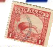
Orewastrand" Noord Auckland