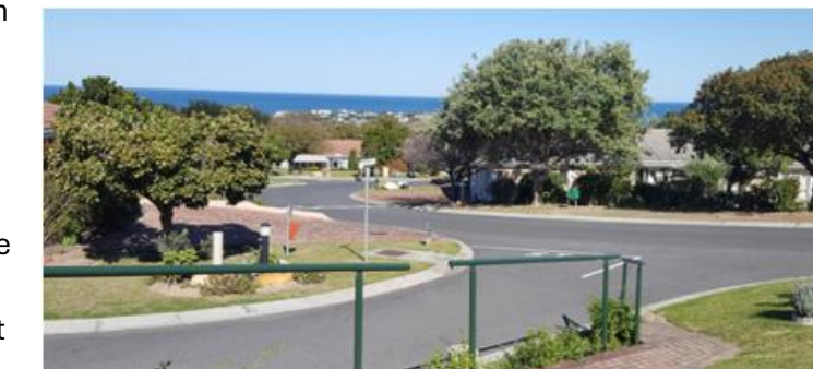
Ou foto- die een links toe ek hom nog sy kop gesnoei het.

Die heilige boom staan nog steeds, maar 'n veel groter een, die een reg voor ons, het omgewaai. Skielik is daar nou weer 'n lekker stuk oop see om dop te hou vir skepe en walvisse en sulke goeters. Dinge wat die lewe lekker maak. Die een man se skade bring vir die ander een genade.